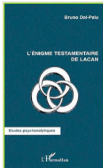
Edition l'Harmattan, 2004

EURL/MDP au capital de 7622,45 Euros. RCS : B379969348 Organisme de formation qualifié OPQF et enregistré sous le N° 91 30 00825 30